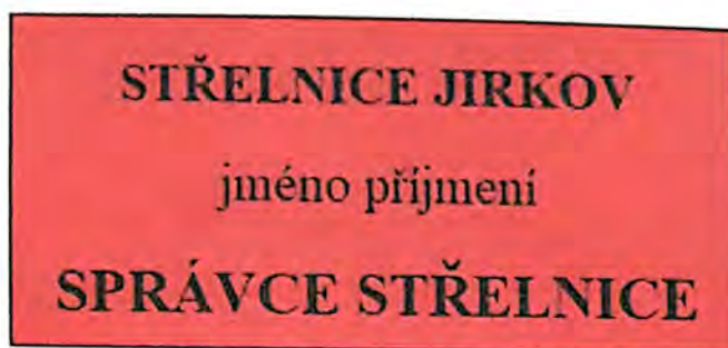
Obrázek 1 - Vzor označení správce střelnice